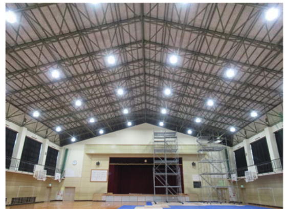
LED照明導入後の甲西北中学校